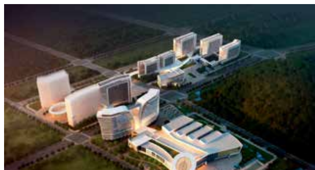
46 | PIONEER INTRODUCTION | 先锋人物